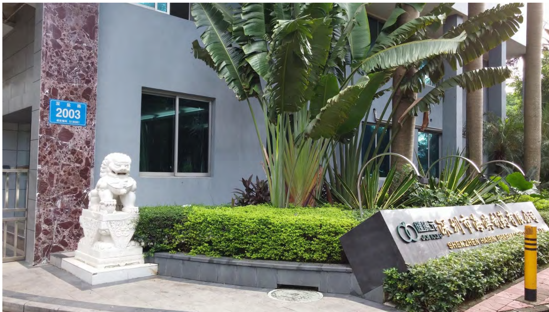
7.2 废水处理工艺设备状况